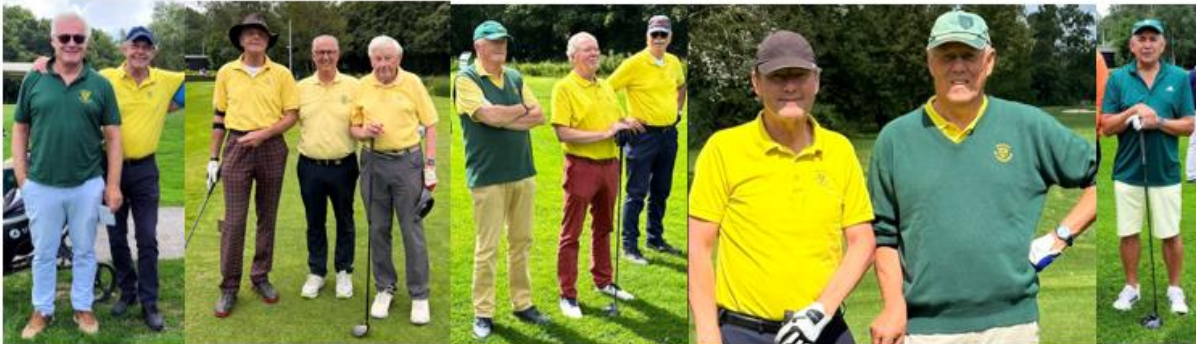
De GG side van de Vereniging, exclusief fotograaf Rob K.

Het kostte even wat tijd maar toen werd het ook echt droog en mooi zonnig weer. En ook de bitterballen kwamen op tijd voor de tweede borrel. Kortom de organisator was weer in zijn missie geslaagd. Theo bedankt !