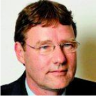
Bijdrage: Menno Alkema